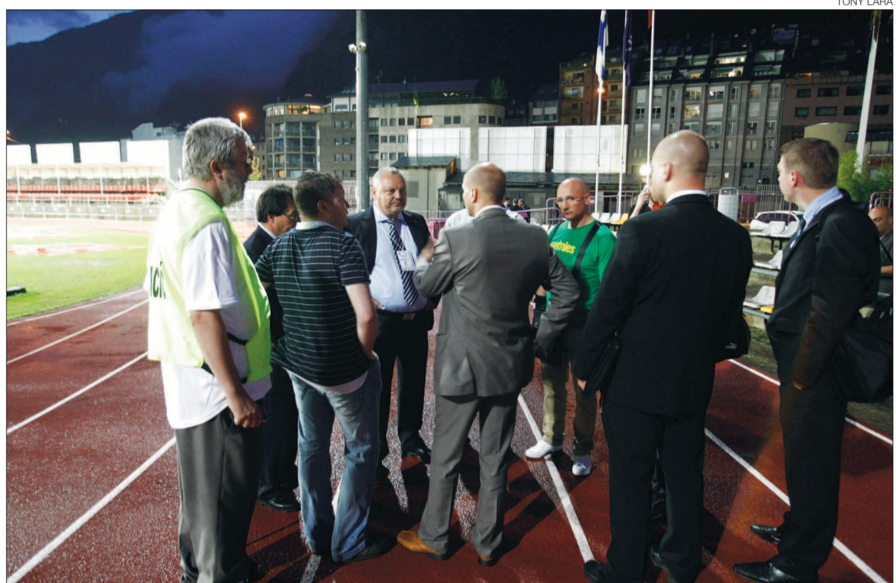
► El que ningú no vol veure: pluja al Comunal i els delegats de la UEFA amb cara d'«això és lamentable».

Almenys, entre les incerteses, una la tenim oblidada, perquè el BC River Andorra ja ha anunciat la